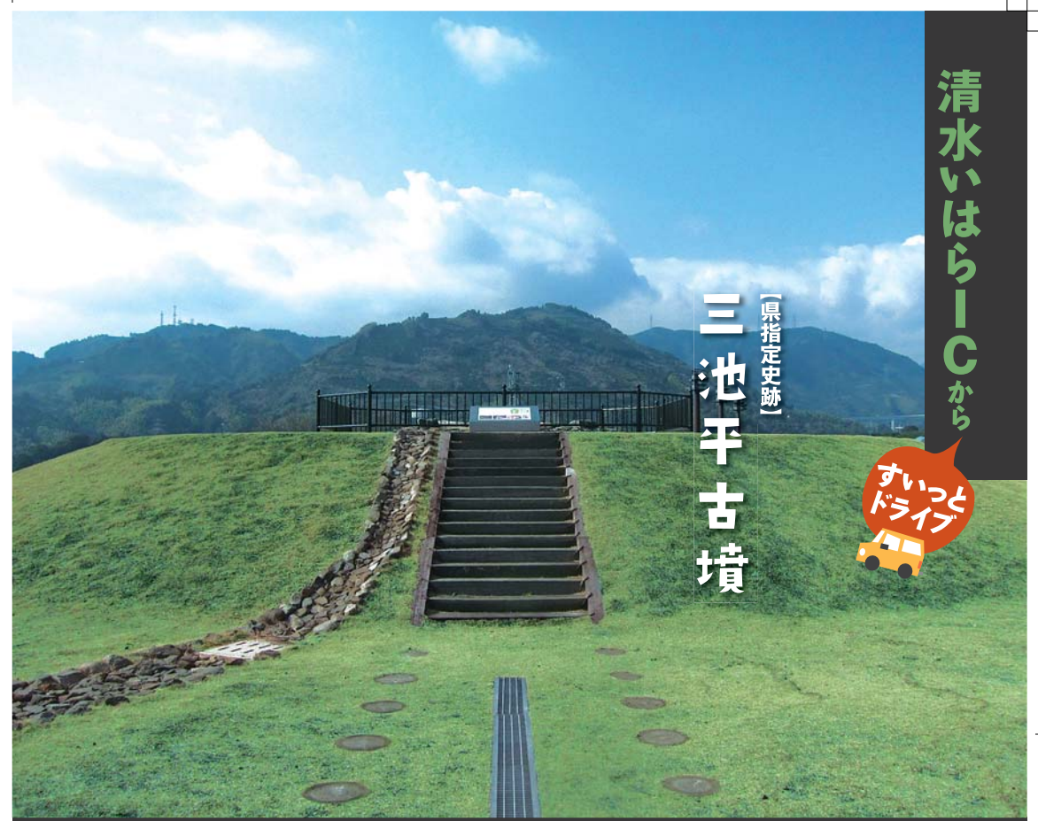
前方後円墳の形がよくわかる古墳の広場